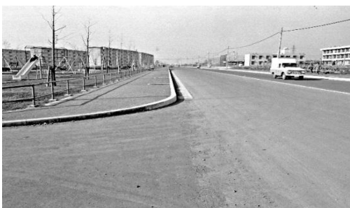
さくら通りと谷保第三公園 1966