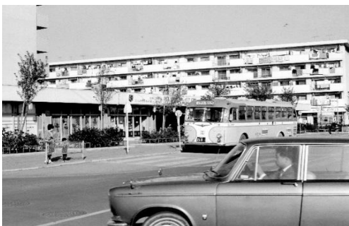
富士見台第一団地バス停付近 1967

場所：くにたち中央図書館 階段壁展示スペース、 2階・3階階段踊り場展示スペース