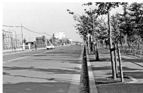
第二中学校付近のさくら通り 1965