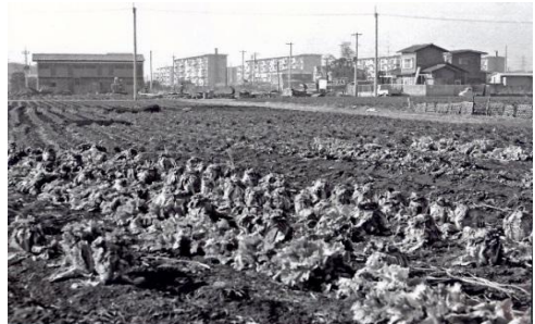
畑の中の第一公園 1966