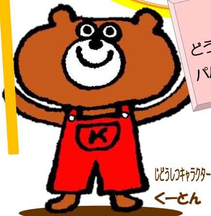
じどうしゅキャラクター くーとん