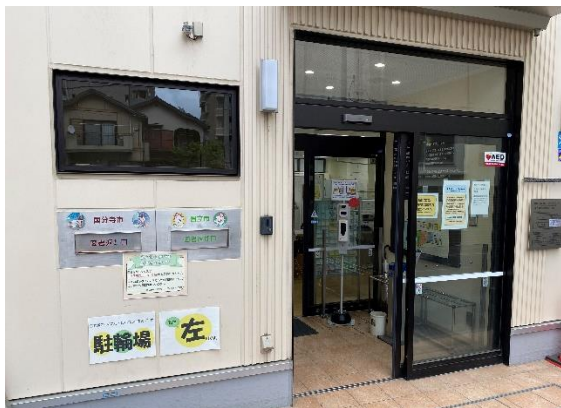
駅前プラザ入口。本の返却口もあります（写真左）