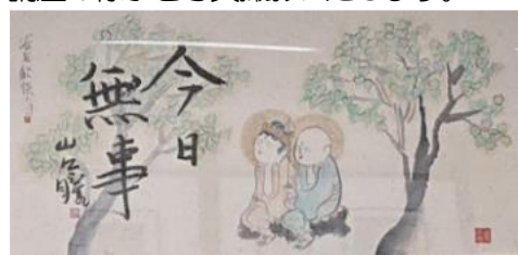
《今日無事》画：関碩亭 書：山口瞳